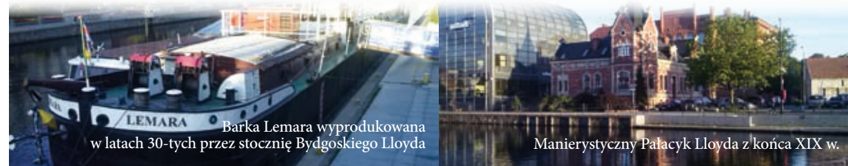
Barka Lemara wyprodukowana w latach 30-tych przez stocznię Bydgoskiego Lloyda

W dzisiejszych czasach żegluga niestety zamarła i mało kto pamięta barki dokowane w Starym Porcie. Gorąco zachęcam natomiast do zwiedzania Barki Lemara, gdzie można zobaczyć jak wyglądało życie jednej z szyperskich rodzin i zagłębić się w temat tradycji Bydgoskiej Żeglugi.