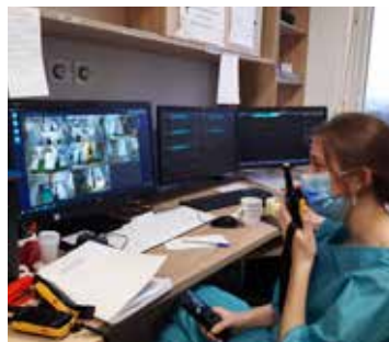
Pielęgniarka po stronie „czystej” odcinka COVID komunikuje się z zespołem po stronie „brudnej” za pomocą walkie-talkie.