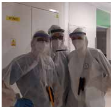
Zespół po stronie „brudnej” 20-lóżkowego odcinka COVID