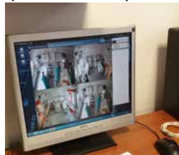
W salach chorych zainstalowane są kamery, dzięki którym można cały czas obserwować pacjentów