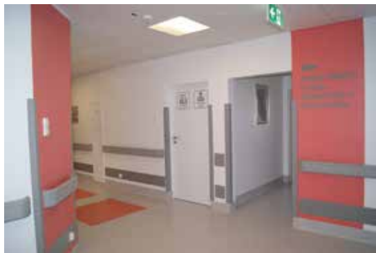
Wyremontowana Klinika Chirurgii Ogólnej, Kolorektalnej i Onkologicznej

Reumoortopedii z nową aparaturą wartą 870 tys. zł oraz Klinika Chirurgii Ogólnej, Kolorektalnej i Onkologicznej na wyposażenie której przeznaczono 500 tys. zł.