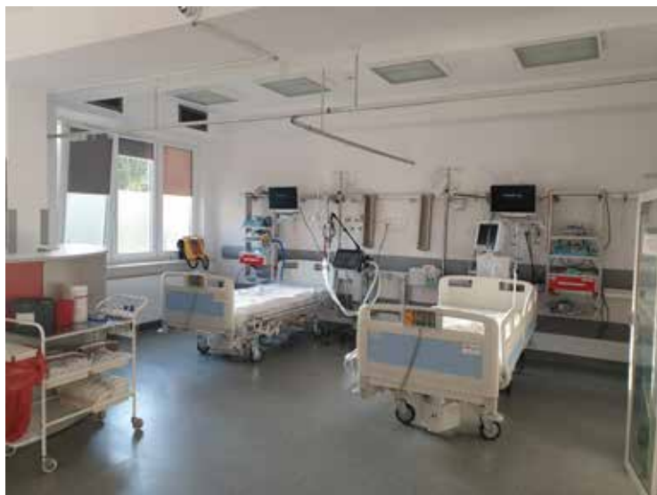
Początek października – „covidowy” odcinek OIT gotowy na przyjęcie pierwszych pacjentów

Przed dużym wyzwaniem stanęli pracownicy nowo utworzonych jednostek „covidowych”, którym przyszło zmierzyć się z zadaniami nie wchodzącymi dotąd w zakres ich obowiązków.