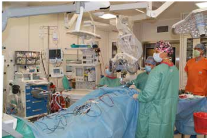
Wyremontowana Sala Operacyjna Kliniki Neurochirurgii

W grudniu 2018 roku w szpitalu odbyła się konferencja prasowa otwierająca projekt. W październiku 2019